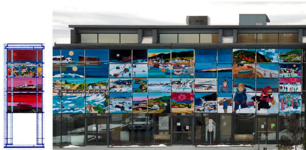
Vitrine du Complexe culturel Joseph-Rouleau

Le Complexe culturel Joseph-Rouleau est situé sur la rue Saint-Jérôme, une avenue principale de Matane où l'achalandage est très élevé. Le bâtiment possède une magnifique verrière qui est exploitée maintenant aux bénéfices des artistes de la région de Matane. Les artistes amateurs ou professionnels en art visuel ont l'opportunité d'afficher leur travail dans la vitrine du Complexe culturel pour l'année 2023-2024. Les œuvres seront affichées du 24 juin 2023 au 23 juin 2024. Il peut s'agir de photographies ou d'autres formes d'expression visuelle.