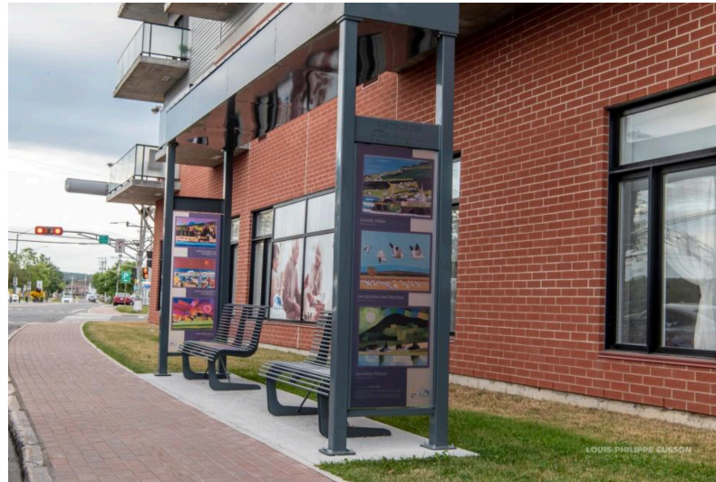
Bancs des Bâtitseurs

Les bancs extérieurs de la Résidence des Bâtitseurs sont situés sur la rue Saint-Jérôme, une avenue principale de Matane où l'achalandage est très élevé. Par beau temps, on y voit souvent des personnes assises à flâner et à regarder passer le temps. Les artistes amateurs ou professionnels en arts visuels ont l'opportunité d'afficher leur travail dans les panneaux situés de chaque côté des bancs. Il y a trois bancs et donc six panneaux. Les œuvres seront affichées du 24 juin 2023 au 23 juin 2024. Il peut s'agir de photographies ou d'autres formes d'expression visuelle.