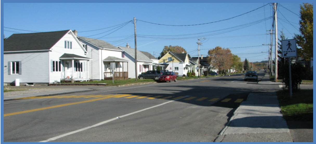
Ajout d'un passage pour piétons sur la rue Saint-Joseph à l'intersection avec la rue Côté

À la suite d'une demande, un passage pour piétons a été aménagé incluant la modification des trottoirs sur la rue Saint-Joseph à l'intersection avec la rue Côté afin de faciliter notamment au Pavillon de la Cité qui regroupe plusieurs organismes communautaires.