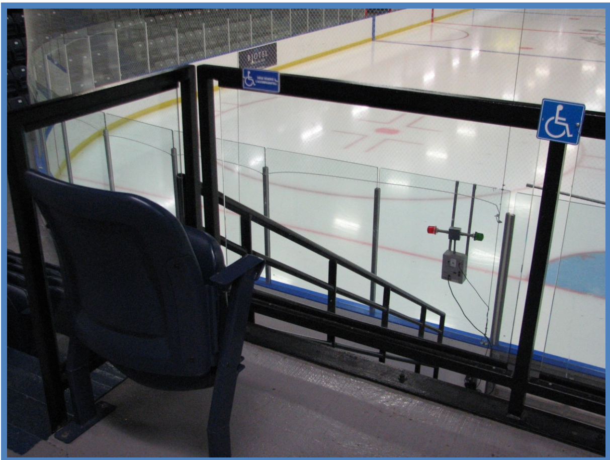
Ajout de la signalisation indiquant les espaces réservés aux personnes handicapées ainsi qu'aux accompagnateurs dans le module Alain-Côté

La signalisation finale indiquant notamment les espaces réservés aux personnes handicapées ainsi qu'aux accompagnateurs a été installée à l'intérieur du bâtiment.