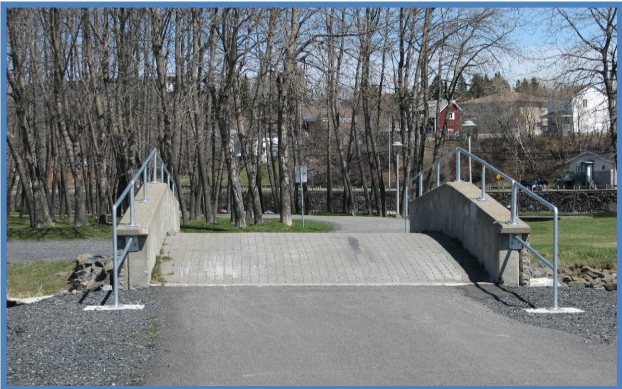
Garde-corps installés sur le pont menant au Parc des Îles

Afin d'améliorer la sécurité et l'accès, des garde-corps ont été ajoutés au pont enjambant la rivière Matane et qui permet l'accès au parc des Îles qui s'avère un équipement récréatif stratégique au centre-ville. Les coûts de fabrication et d'installation s'élèvent à environ 5000 $.