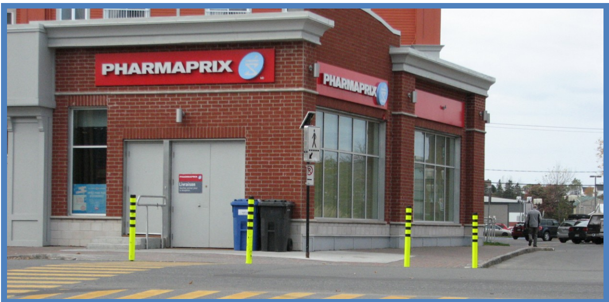
Amélioration de la signalisation au passage pour piétons situé sur l'avenue Saint-Jérôme près de la Place des Générations

Une meilleure signalisation a été ajoutée à deux passages pour piétons pour les rendre plus sécuritaire. D'abord, au centre-ville, des bollards ont été ajoutés au passage pour piétons situé à l'intersection de l'avenue Saint-Jérôme et de la rue Otis près de la Place des Générations. Ensuite, des panneaux de signalisation et des bollards ont été ajoutés au passage pour piétons situé à l'intersection de l'avenue Saint-Rédempteur et de la rue Thibault afin d'améliorer la visibilité.