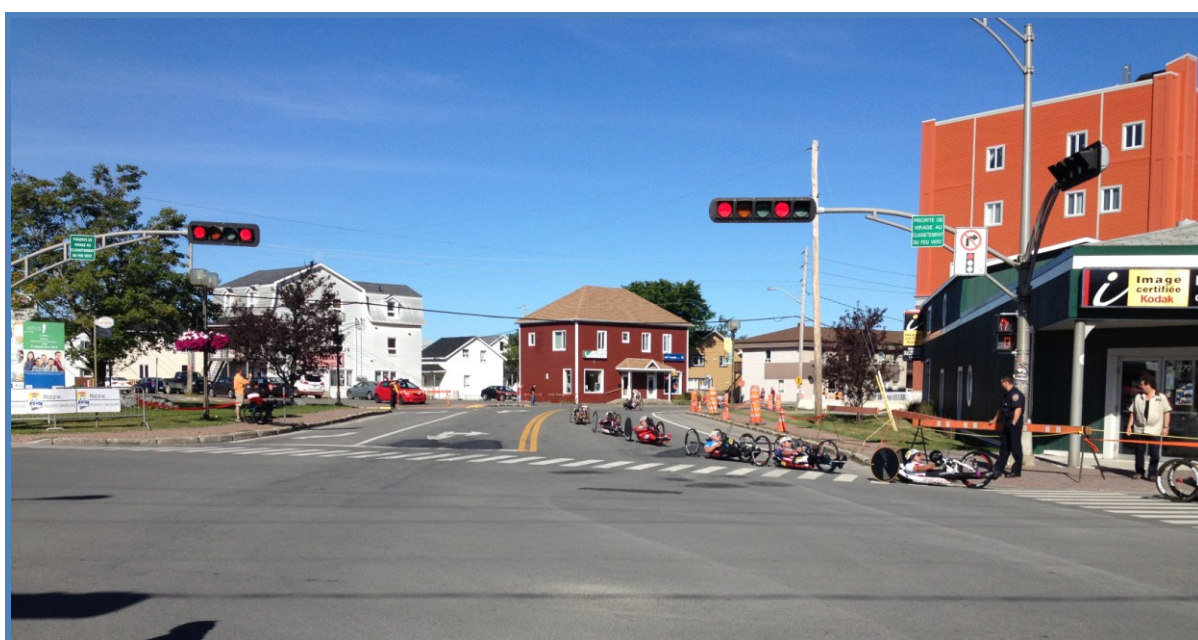
Course au centre-ville à l'intersection de l'avenue Saint-Jérôme et de la rue du Bon-Pasteur

Enfin, la Ville de Matane a accueilli du 22 au 25 août 2013 un événement sportif d'envergure internationale à savoir une course de paracyclisme. L'implication de la Ville a été très importante. L'investissement financier est estimé à environ 135 000 $.