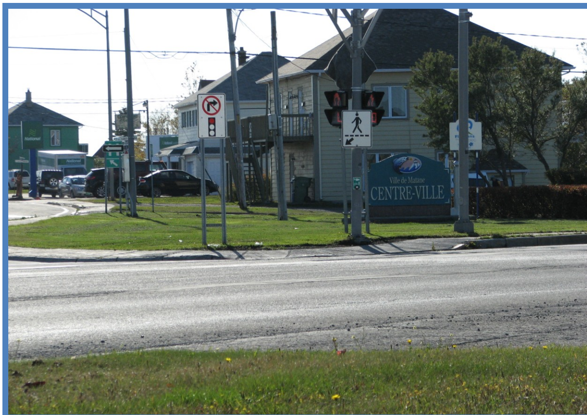
Réfection d'un trottoir à l'intersection de l'avenue D'Amours et de l'avenue du Phare Est (route 132)

La Ville a complété les travaux sur des trottoirs afin de les rendre accessibles. Ceux-ci sont situés à l'intersection de l'avenue du Phare Ouest et de l'avenue Fraser, de l'avenue Saint-Jérôme et de l'avenue D'Amours. Ces travaux ont débuté en 2012.