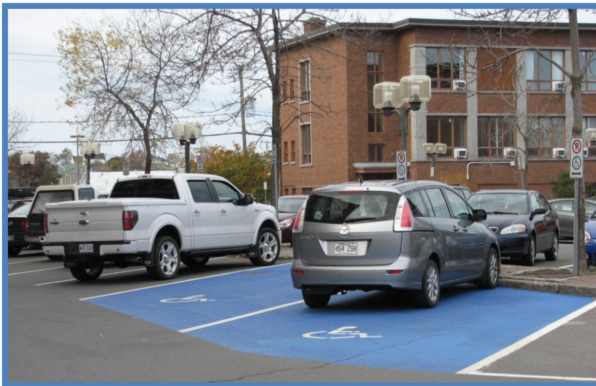
Ajout de deux cases réservées à l'usage exclusif des personnes handicapées au centre-ville

De plus, dans le stationnement public, une zone de débarcadère a été aménagée près de l'entrée principale de cette résidence afin de favoriser un accès plus sécuritaire lorsque notamment des résidents descendent de l'autobus adapté.