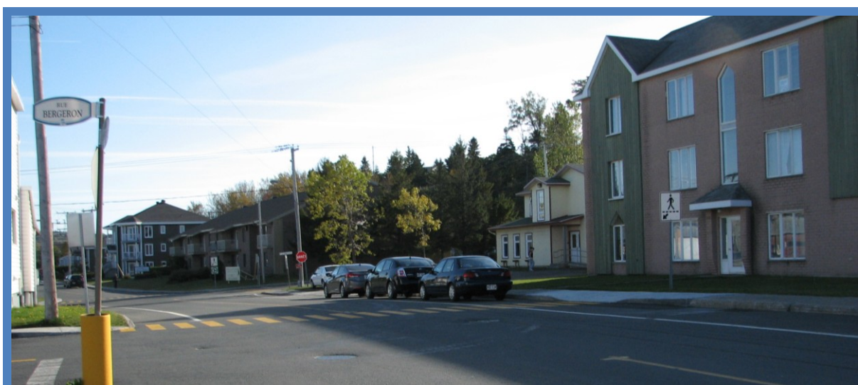
Ajout d'un passage pour piétons sur la rue de la Gare à l'intersection avec la rue Bergeron

À la suite d'une requête, des passages pour piétons ont été aménagés sur la rue de la Gare à l'intersection avec la rue Bergeron et à l'intersection avec la rue Saint-Jean afin de faciliter notamment l'accès à un centre de la petite enfance. Les trottoirs ont dû être modifiés.