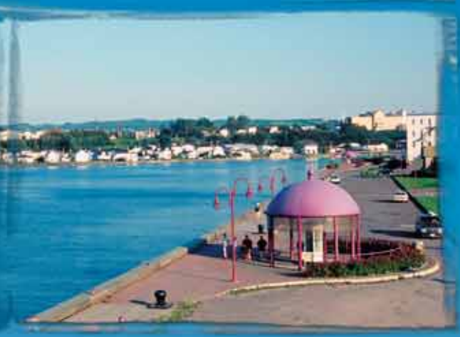
Photo : Louis-Philippe Cusson, promenade des Capitaines/Captain's walk